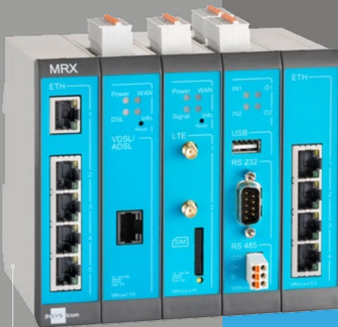
MRX5 DSL inkl. MRcards PL, SI und ES

Voll-modularer Industrierouter für VDSL-/ADSL-Anwendungen