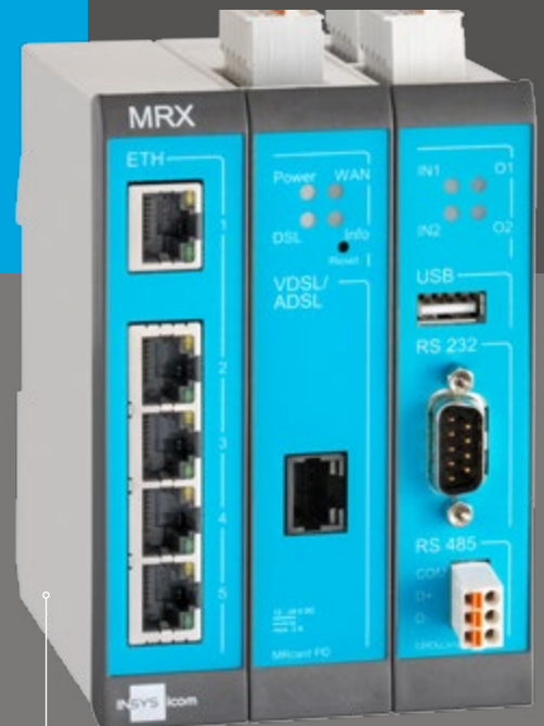
MRX3 DSL inkl. MRcard SI